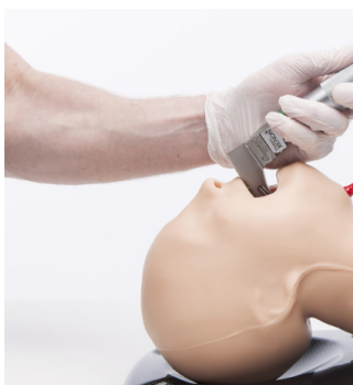
AIRSIM BABY X

Les mannequins AirSim "Child" et "Baby" intègrent des voies respiratoires et une cavité nasale aux designs innovants basés sur de réelles imageries médicales (IRM patients) et dont la robustesse a fait la légende!