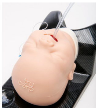
AIRSIM PIERRE ROBIN X